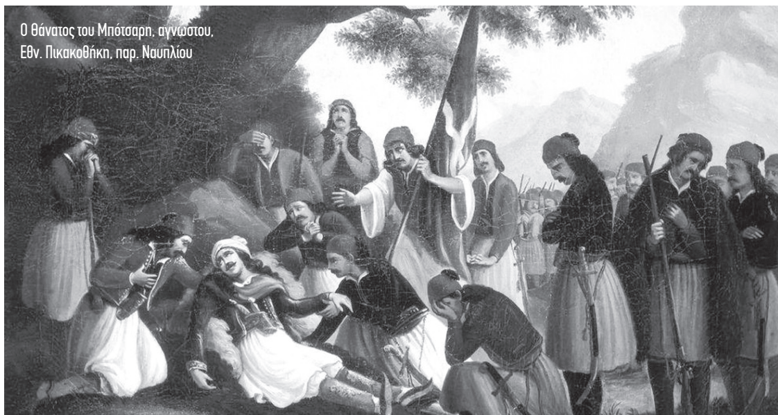
Ο θάνατος του Μπότσαρη, αγνώστου. Εθν. Πικακοθήκη, παρ. Ναυπλίου

χώρου. Η πρακτική της αποστολής επίσημων, συλλογικών ή ατομικών αναφορών προς την κεντρική Αρχή, με σκοπό την αποκατάσταση μιας αδικίας ή την ευνοϊκή μεταχείριση σε σειρά ζητημάτων, γνωστή ως petitioning , αποτελούσε συνήθη πρακτική εκδήλωσης της κοινωνικής δυσαρέσκειας και διαμαρτυρίας, αλλά και βασικό μέσο παρέμβασης των υπάλληλων στρωμάτων στην κεντρική πολιτική σκηνή για τις κοινωνίες του πρώιμου νεότερου κόσμου και ως εκ τούτου για την οθωμανική κοινωνία (Lex Heerma van Voss, 2002).