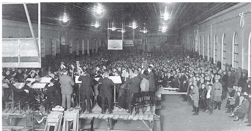
Εικόνα 2: Συναυλία της ορχήστρας στα μέσα της δεκαετίας του 20 στη στρατιωτική σχολή Anshenbrenners.

σύντομα η φήμη για την πολυμελή ορχήστρα που έπαιζε χωρίς τον συντονισμό ενός μαέστρου έγινε αντικείμενο συζήτησης και ατελείωτης αντιπαράθεσης στον Τύπο. Η ύπαρξη ενός τέτοιου τύπου ορχήστρας, πόσο μάλλον η επιτυχής λειτουργία της, προκάλεσε μεγάλο ενθουσιασμό σε πολλούς, ενώ παράλληλα αποτελούσε παραφωνία στα αυτιά της συντήρησης. Για ορισμένους κύκλους το εγχείρημα αυτό φάνταζε σχεδόν εξίσου τρομακτικό με αυτό της πρώτης εργατικής κυβέρνησης.