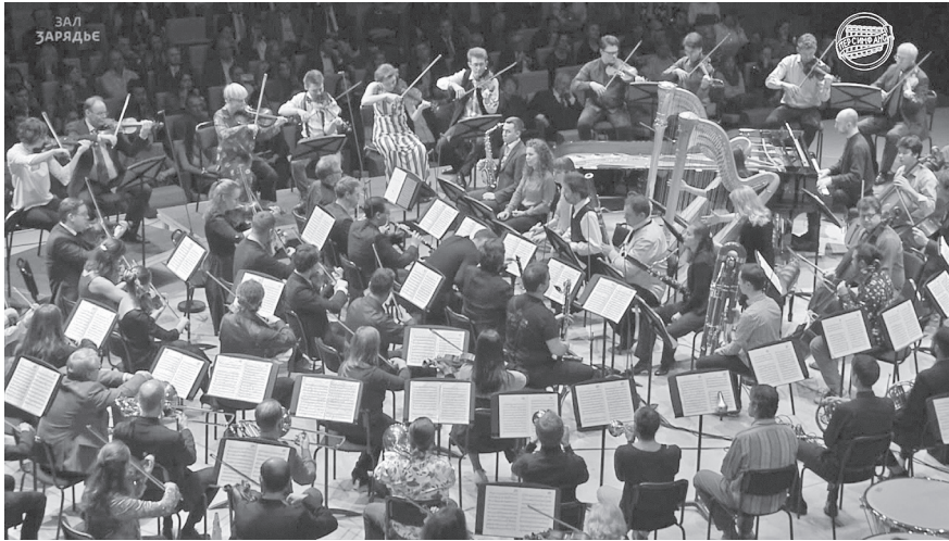
Εικόνα 4: Συναυλία του από τη σύγχρονη Persimfans που επιχειρεί αναβίωση των ορχηστρών χωρίς μάεστρο.

φτικε από το κόμμα και στάλθηκε στην εξορία ενώ το 1929 καθαιρέθηκε και ο Ανατόλι Λουνατσάρσκι από επίτροπος Πολιτισμού και Επιμόρφωσης.