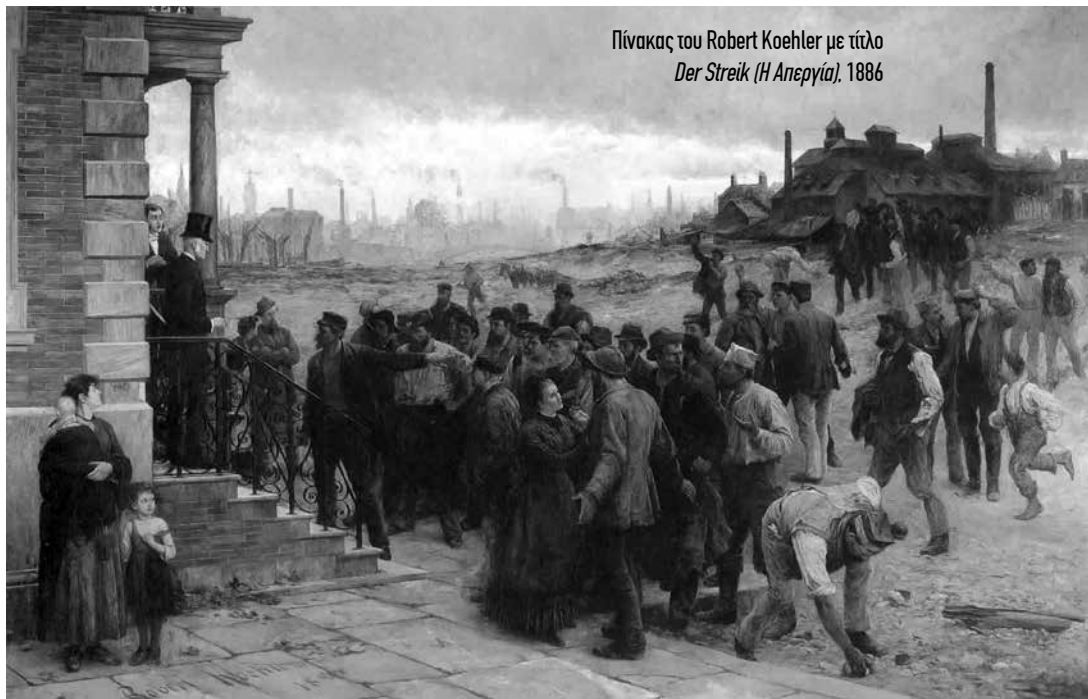
Πίνακας του Robert Koehler με τίτλο Der Streik (Η Ανεργία) , 1886

αναγκαία η σύγκρουση με το κράτος εν όλω, αλλά με μέρη του. Η σύγκρουση με «κρατικοκοινωνικά» μορφώματα όμως αποτελεί μια παραλλαγή, επί το ριζοσπαστικότερο, συσσώρευσης ρεφορμιστικού τύπου νικών και κατακτήσεων σ' αυτά τα κρατικοκοινωνικά μορφώματα. Η υπερεκτίμηση της συναίνεσης και της ηγεμονίας από τη γραμμή Γκράμσι αναπαράγεται και στη μεταγενέστερη αντίληψη Πουλαντζά που θεωρεί το κράτος συμπύκνωση και συσχετισμό των ταξικών αντιθέσεων.