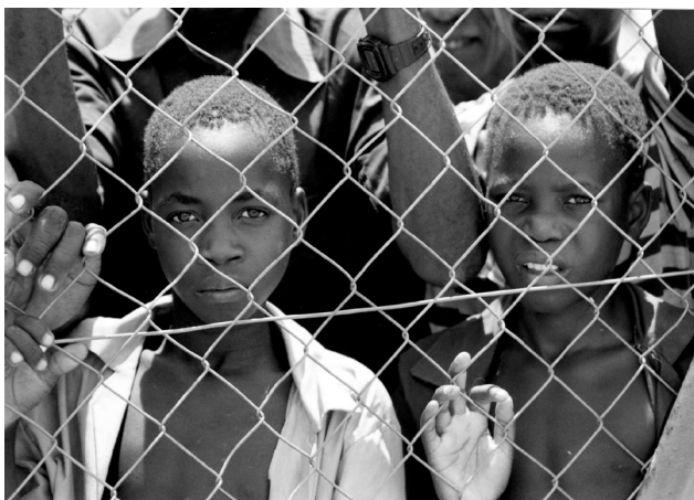
Σύνορα Μαλάουι-Μοζαμβίκης, Μάιος 1995