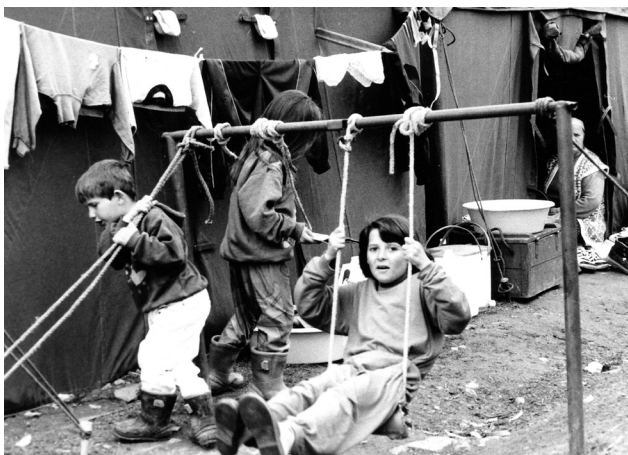
Σκόπια, Απρίλιος 1999