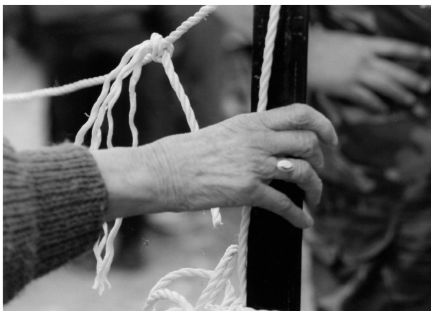
Σκόπια, Απρίλιος 1999