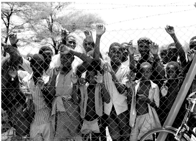
Σύνορα Μαλάουι-Μοζαμβίκης, Μάιος 1995

(Από τη συλλογή Ο θάνατος του Μύρωνα , 1960· συγκεντρωτική έκδοση: Ο δύσκολος θάνατος , Αθήνα, Νεφέλη, 2007)