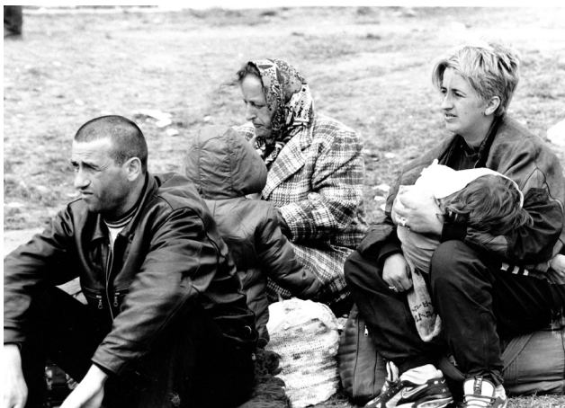
Σκόπια, Απρίλιος 1999