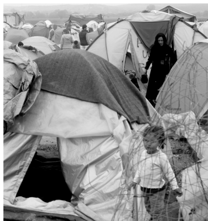
Ειδομένη, Απρίλιος 2016