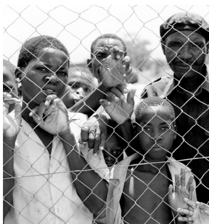
Σύνορα Μαλάουι-Μοζαμβίκης, Μάιος 1995