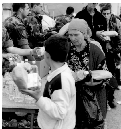
Σκόπια, Απρίλιος 1999