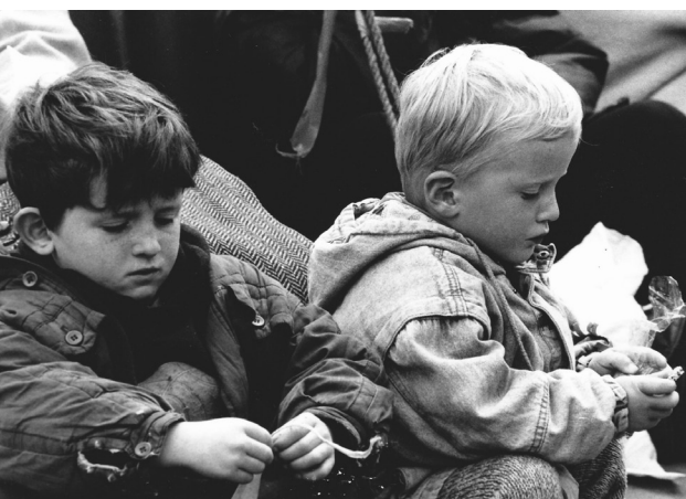
270 Σκόπια, Απρίλιος 1999