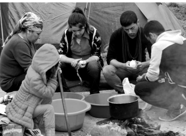
Ειδομένη, Απρίλιος 2016