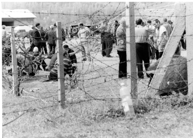
Σκόπια, Σεπτέμβριος 1999