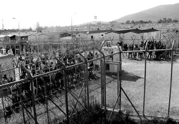
Αχαρνές, Αμυδαλέζα, Μάρτιος 2015