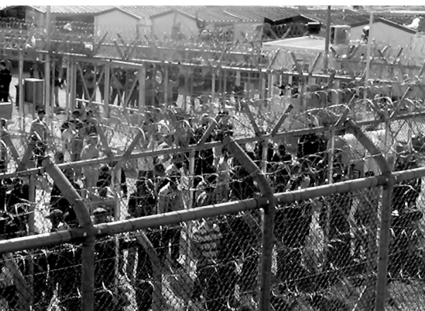
Αχαρνές, Αμυδαλέζα, Μάρτιος 2015