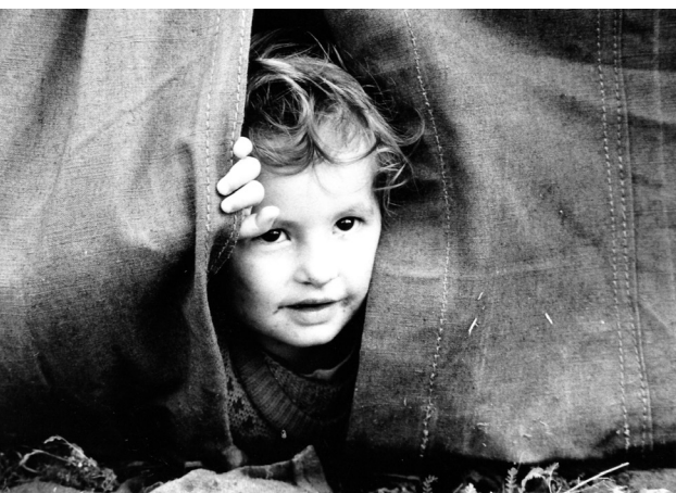
Σκόπια, Σεπτέμβριος 1999