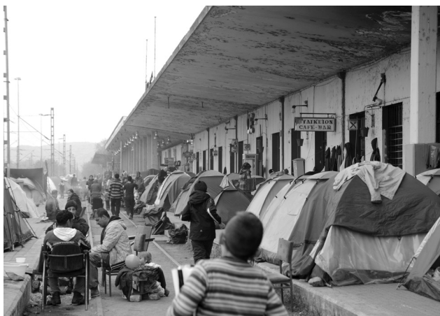
Ειδομένη, Απρίλιος 2016

(Από τη συλλογή Δεν γνωρίζω δεν απαντώ , Αθήνα, Κέδρος, 2004)