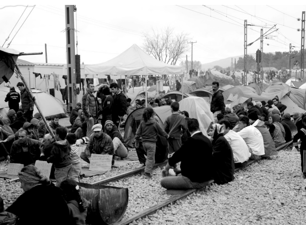
Ειδομένη, Απρίλιος 2016