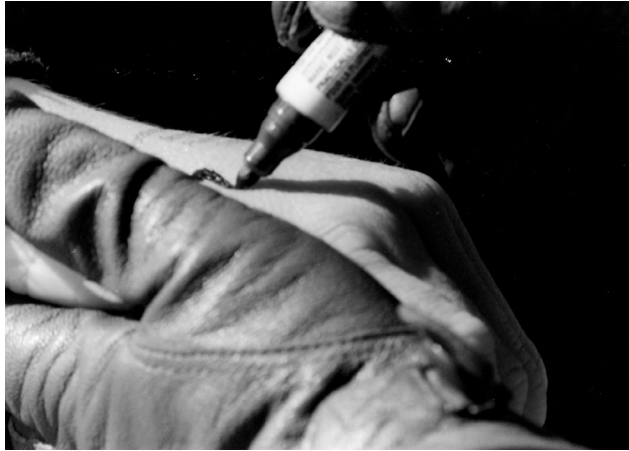
Σκόπια, Απρίλιος 1999

αράπηδες με τα χέρια απλωμένα μυρίζετε περίεργα απολίτιστοι κάνετε λίμπα τη χώρα σας και τώρα θέλετε να κάνετε και τη δική μας πώς δε δίνουμε σημασία στα λόγια στα άγρια βλέμματα ίσως επειδή τα χτυπήματα είναι πιο απαλά από το ξεριζώμα ενός χεριού ή ποδιού ή τα λόγια είναι πιο τρυφερά από δεκατέσσερις άντρες ανάμεσα στα πόδια σου ή οι προσβολές είναι πιο εύκολο να καταπιείς από τα χαλίκια από τα κόκαλα από το κομματιασμένο κορμάκι του παιδιού σου. θέλω να γυρίσω στην πατρίδα, αλλά η πατρίδα είναι το στόμα ενός καρχαρία πατρίδα είναι η κάνη ενός όπλου και κανένας δε θα άφηνε την πατρίδα εκτός αν η πατρίδα σε κυνηγούσε μέχρι τις ακτές εκτός αν η πατρίδα σου έλεγε να τρέξεις πιο γρήγορα να αφήσεις πίσω τα ρούχα σου να συρθείς στην έρημο να κολυμπήσεις ωκεανούς να πνιγείς να σωθείς να πεινάσεις να εκλιπαρήσεις να ξεχάσεις την υπερηφάνεια η επιβίωσή σου είναι πιο σημαντική. κανένας δεν αφήνει την πατρίδα εκτός αν η πατρίδα είναι μια ιδρωμένη φωνή στο αυτί σου που λέει φύγε, τρέξε μακριά μου τώρα δεν ξέρω τι έχω γίνει αλλά ξέρω ότι οπουδήποτε αλλού θα είσαι πιο ασφαλής απ' ό,τι εδώ.