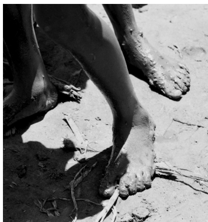
Σύνορα Μαλάουι-Μοζαμβίκης, Μάιος 1995