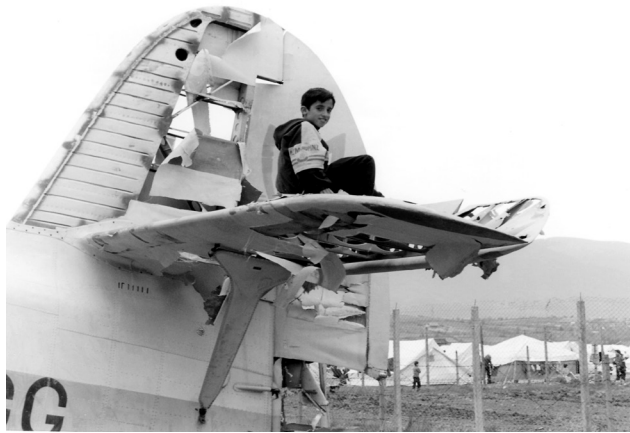
Σκόπια, Απρίλιος 1999

Κανένας δεν αφήνει την πατρίδα του, εκτός αν πατρίδα είναι το στόμα ενός καρχαρία τρέχεις προς τα σύνορα μόνο όταν βλέπεις ολόκληρη την πόλη να τρέχει κι εκείνη οι γείτονές σου τρέχουν πιο γρήγορα από σένα με την ανάσα ματωμένη στο λαιμό τους το αγόρι που ήταν συμμαθητής σου που σε φιλούσε μεθυστικά πίσω από το παλιό εργοστάσιο τσίγκου κρατά ένα όπλο μεγαλύτερο από το σώμα του αφήνεις την πατρίδα μόνο όταν η πατρίδα δε σε αφήνει να μείνεις. κανένας δεν αφήνει την πατρίδα εκτός αν η πατρίδα σε κυνηγά