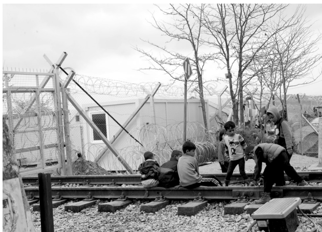
Ειδομένη, Απρίλιος 2016

Όταν η θάλασσα απόθεσε τεμάχιο νεκρής νήπιας σάρκας στον αιγιαλό των χρηματιστηριακών δεικτών οι αξίες των μετοχών μεταβλήθηκαν αναλόγως με την άρθρωση παρήγορου λόγου των δημοκρατικά εκλεγμένων