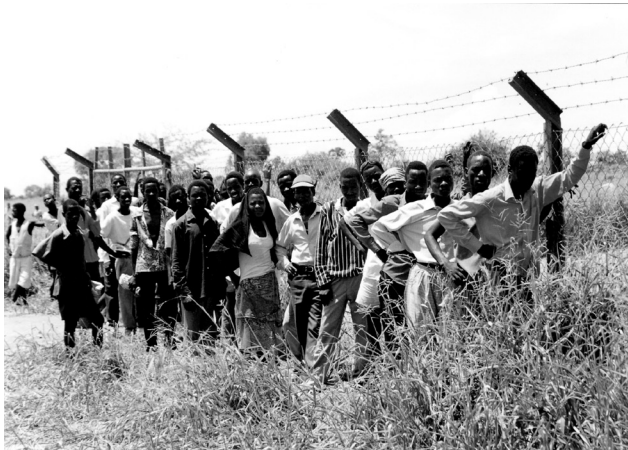
Σύνορα Μαλάουι-Μοζαμβίκης, Μάιος 1995