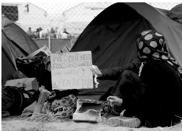
Ειδομένη, Απρίλιος 2016