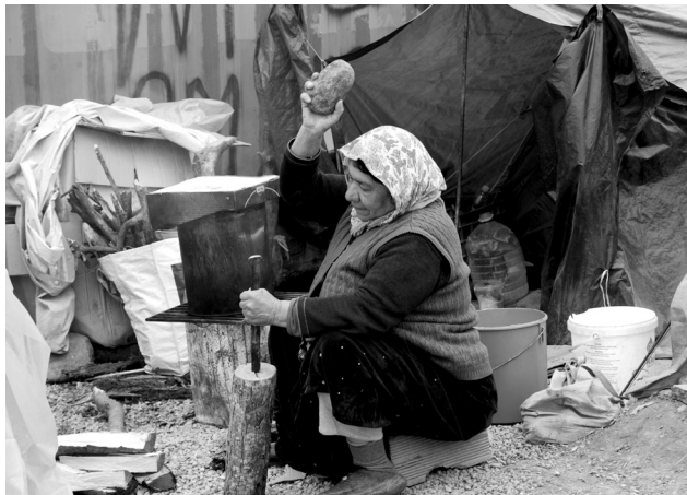
Ειδομένη, Απρίλιος 2016