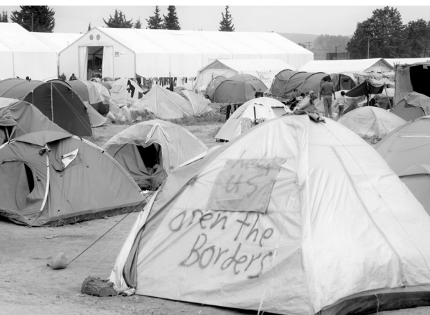
Ειδομένη, Απρίλιος 2016