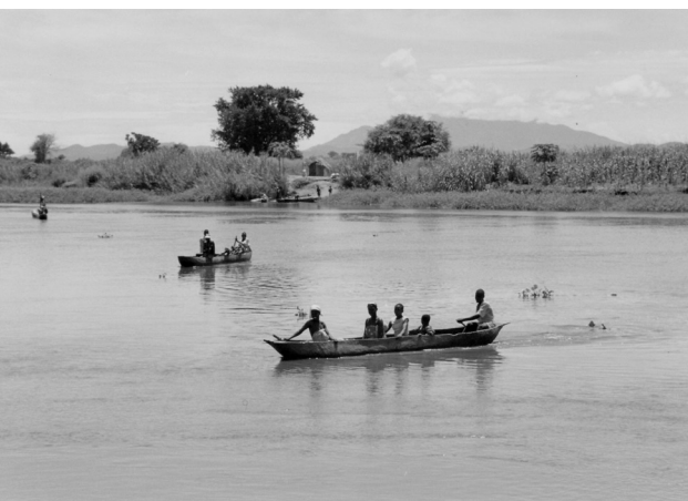
Σύνορα Μαλάουι-Μοζαμβίκης, Μάιος 1995