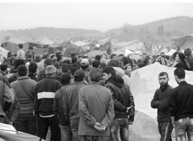
Ειδομένη, Απρίλιος 2016