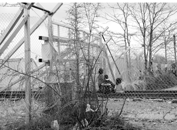
Ειδομένη, Απρίλιος 2016